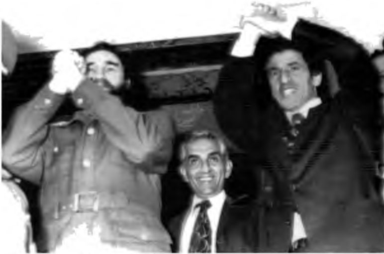
أثناء استقبال رئيس الوزراء الليبي عبد السلام جلود للزعيم الكوبي فيدل كاسترو في طرابلس، ليبيا، 2 / 3 / 1977.